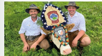
Larch Peter „Neubauhof“ von der Pfundsalm | Hochfügen im Zillertal