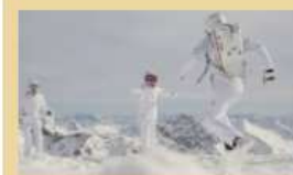
ÖW & TW Kampagnen

Als Partner der Marketingkooperationen mit der Österreich Werbung und der Tirol Werbung bieten wir euch die Möglichkeit, mit uns auf diesen Kampagnenplattformen vertreten zu sein.