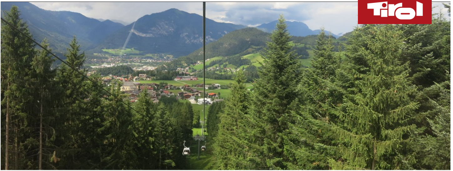
Auffahrt mit der Reitherkogelbahn